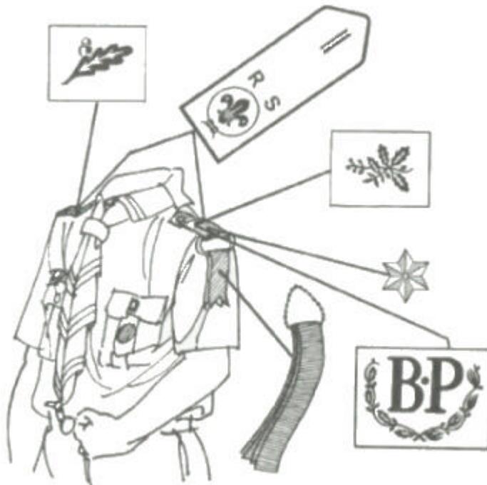
Insignias de adelanto para Rover Scouts. Actuales (1994).

Las reglas referentes al uniforme, durante mal tiempo, en el caso de Scouts Marinos (ver Regla 25) se aplican a los Rover Scouts Marinos.